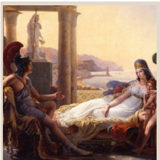
Enée & Didon, par Pierre-Narcisse Guérin